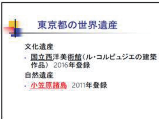
▲ 東京都の世界遺産