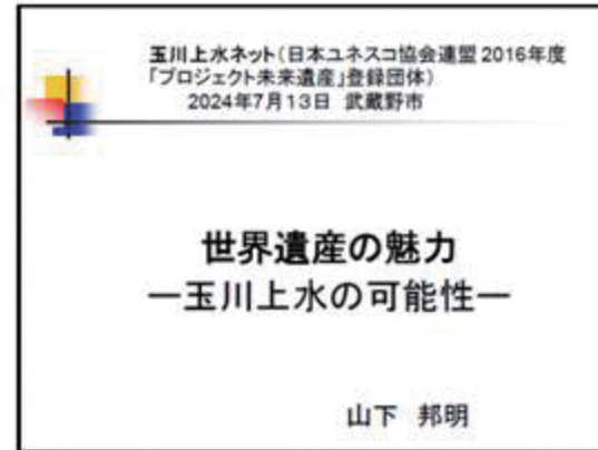
▲ スライド/タイトル

1971年上智大学外国語学部英語学科卒。 74年特定非営利活動法人日本ユネスコ協会連盟(略称:日ユ協連)事務局に入局。 94年国際連合教育科学文化機関(UNESCO、パリ)に奉職。 2003年国立大学法人九州大学言語文化研究院教授に就任、同研究院長、総長特別補佐などを歴任。ユネスコを中心に国際社会への貢献と国際機関、国際協力人材育成に取り組み、数々の成果を上げてきた。