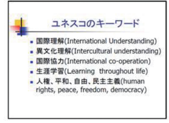
▲ ユネスコのキーワード