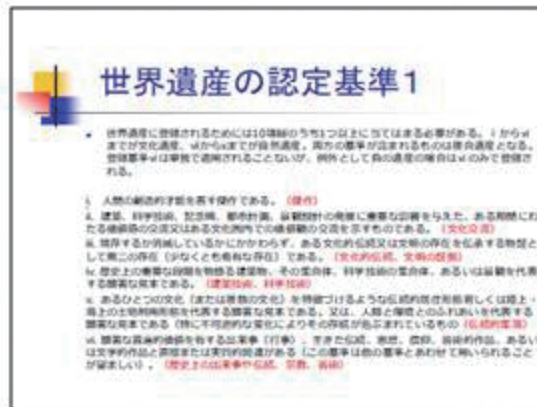
▲ 世界遺産の認定基準1