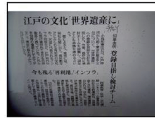
▲ 江戸の文化「世界遺産に」