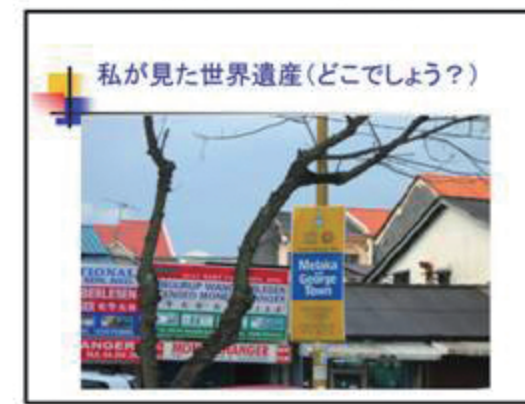
▲ 私が見た世界遺産