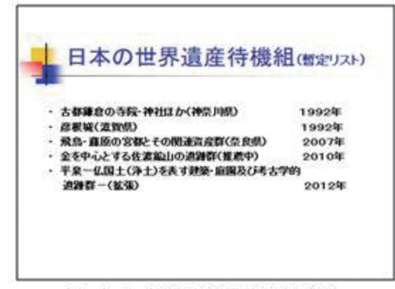
▲ 日本の世界遺産待機組