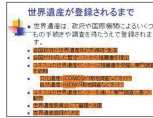
▲ 世界遺産が登録されるまで